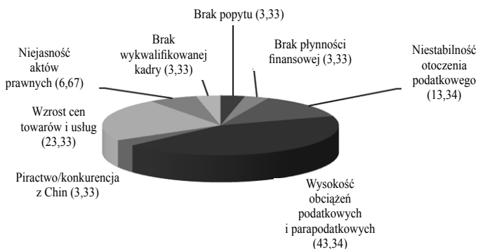
Rys. 2. Skutki zdarzeń najdotkliwiej odczuwalnych przez przedsiębiorstwa (%)

Na rysunku 1 przedstawiono najczęściej brane pod uwagę elementy w zarządzaniu firmą. Badani przedsiębiorcy w codziennej działalności przede wszystkim uwzględniają otoczenie podatkowe (40%) oraz sytuację rynkową (33%), głównie wskazywano progi skali podatkowej oraz jakość obsługi podatkowej. Zdaniem przedsiębiorców w sytuacji rynkowej ważna jest koniunktura, konkurencja, popyt na towary i usługi, rynek pracy, liczba zleceń oraz kursy walut.