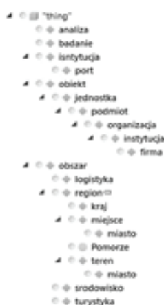
Rysunek 4. Przykład układania relacji w analizie decyzyjnej

ich rezultatów jako bytów współistniejących. W przypadku opracowań zbioru słów mającego wchodzić w skład ontologii, zastosowana metoda wyszukiwała zwrotów w dwóch dokumentach: bazowym, czyli wzorze wniosku projektowego (opracowanym ekspercko) oraz jednym, wybranym z dostarczonej próby 20 wniosków projektowych. Następnie zwroty zostały porównane parami w każdym z dokumentów, przy wyszukiwaniu tych, których powtarzalność była większa niż dwa. Pozwoliło to na zbudowanie bazy 200 słów i zwrotów, która stała się wyjściową do opracowania drzewa ontologii. Kolejny krok zakłada opracowanie relacji, czyli „stosunku lub zależność między (...) pojęciami” (Słownik języka polskiego PWN, 2011). Etap ten wymaga największych nakładów pracy, dlatego warto skorzystać z dostępnych narzędzi wspierających budowę ontologii – fragment modelu ontologii utworzonego z wykorzystaniem programu Fluent Editor został przedstawiony na rysunku 4.